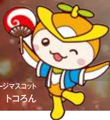
所沢市イメージマスコット ところん

みんなが待っていた「ところざま祭り」。 秋のビッグイベントの幕があがるのはもうまもなくです。 華やかなパレード、威勢のいいお神輿、情熱のサンバカーニバル、 そして伝統の祭りばやし、街の熱気を盛りあげる華麗な山車のひきまわし。 日暮れからは提灯に彩られた山車と山車とが向きあって おかめ、ひょっとこ、藤助、天狐などが舞い踊る 「曳っかわせ」で祭りはクライマックスを迎えます。 熱演の昼、幻想の夜。さあ、感動の祭り舞台を 心ゆくまでお楽しみください。